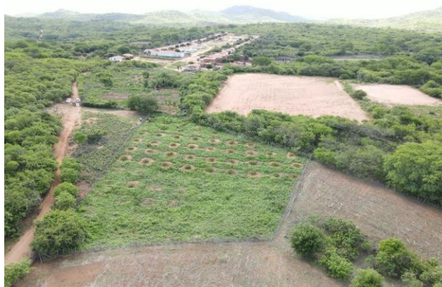
Figura 3- Vista aérea de área de Produção de Frutas no PA 2 de Maio

A grande reflexão nesse ponto é que como há apenas um comprador para ser ofertado os produtos da polpa de fruta, a dependência de um único cliente para ser ofertado gera um potencial risco de dificuldade financeira e de escoamento da produção. Pois, em momentos de cancelamento da aquisição por parte do governo não haverá uma alternativa a oferta da produção. Por isso, é fundamental que a cooperativa busque inserção comercial no mercado chamado de convencional. Que é basicamente a venda par ao mercado varejista do município e circunvizinhança.