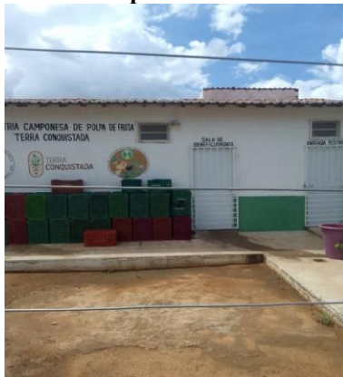
Figura 2 - Agroindústria de Polpa de Frutas no Assentamento 2 de maio

Assim, aquisição do principal insumo, isto é, de frutas produzidas por assentados se dá majoritariamente de frutas de outros Assentamentos e não somente do Assentamento 2 de maio. O que por se só não seria um problema, já que a estrutura está efetivamente dentro do PA 2 de maio com cooperados e pessoas contratadas de dentro do assentamento, gerando renda para a comunidade (figura 2).