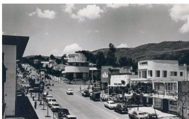
En ville, avenue Royale. Actuelle avenue Patrice Emery LUMUMBA avant 1970.