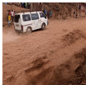
Route kadorhu – busoka passant par le site yesu – yesu à cimpunda : Août 2020