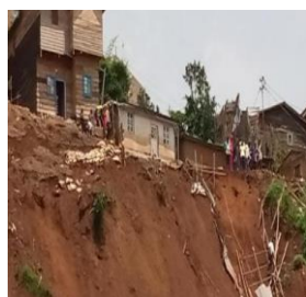
Ressent éboulement de terre à Bukavu, quartier Nyakaliba : 25 avril 2022.