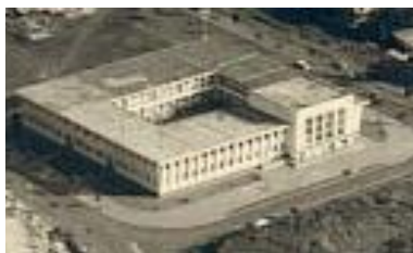
La poste de Bukavu avant 1970.

Comparativement aux images datant de la ville de Bukavu présentées ci-dessous, l'on note actuellement, un recul sur plusieurs plans notamment l'aménagement de la ville (la répartition et l'occupation spatiale des espaces), la maîtrise de la démographie et la fourniture des services sociaux de base (voirie urbaine et drainage, électricité, eau potable, installations sanitaires et accès aux soins, éducation, protection sociale) et la protection de l'environnement.