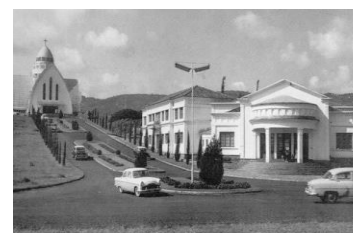
Cathédrale Notre Dame de Bukavu : Presbytère avant 1970.