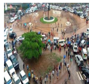
Inondations de la voirie urbaine de la ville de Bukavu, place de l'indépendance : 27 octobre 2020.

La réduction des dégâts matériels et des pertes en vies humaines régulièrement enregistrés à Bukavu serait possible dans la mesure où la Mairie de Bukavu et la Province disposeraient des politiques publiques tenant compte de la croissance de la population, de la répartition spatiale des espaces et de la protection des ressources naturelles, ont affirmé les personnes ressources. Malgré cela, l'absence de la volonté politique et la vision prospective dans le chef des autorités politico-administratives locales, la délivrance des permis de construire sans études préalables, le faible financement et/ou le détournement des fonds alloués à la construction et réhabilitation des infrastructures socio-économiques de base au niveau de la ville, continuent à renforcer le niveau de vulnérabilité de la population de Bukavu et à retarder son développement urbain.