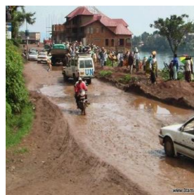
Route essence – maria kachelewa en état de délabrement, commune de Bagira : avril 2020

Selon les enquêtés, la réhabilitation de ces tronçons routiers, actuellement en état d'impraticabilité, figurait dans le Plan de Développement Urbain (PDU) de la ville de Bukavu, comme actions à réaliser. Les images ci-dessous, capturées entre 2020 et 2022, illustrent quelques cas des routes en état de délabrement avancé à Bukavu.