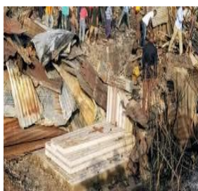
Tombe découverte dans une maison incendiée à Bukavu. La Mairie ordonne sa démolition : 1 juin 2020

Les images ci-dessous illustrent les cas d'incendies, d'éboulements de terre et inondations, conséquences des constructions anarchiques et sur des sites impropres (cimetières, littoral du lac Kivu, espaces verts, équipements collectifs,...) et des pluies diluviennes qui se sont abattues sur la ville de Bukavu, ces cinq (5) dernières années.