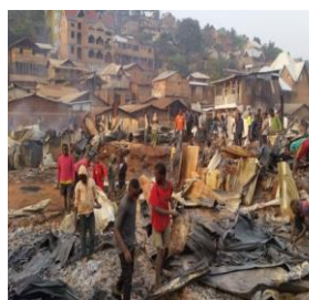
Incendie à Bukavu : près de 200 maisons parties en fumée dans le quartier Nyalukemba : août 2018.