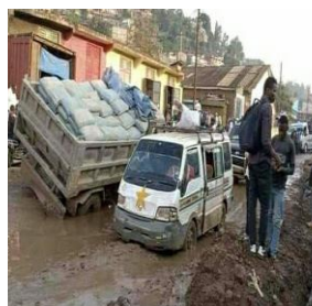
Route industriel dans la commune de Kadutu (route d'intérêt économique) : janvier 2022