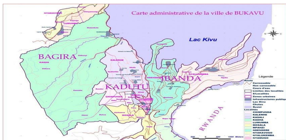
Figure 1. Carte administrative de la ville de Bukavu.

L'étude s'est réalisée dans la ville de Bukavu, chef-lieu de la province du Sud-Kivu à l'Est de la République Démocratique du Congo. Situé entre 2°31' de latitude Sud et 28° 50' de longitude Est 23 , Bukavu a 60 Km 2 de superficie et, est administrativement subdivisé en trois (3) communes notamment Kadutu, Ibanda et Bagira. 24 Ses origines remontent à l'époque coloniale (1900) lors de la fondation du poste militaire de Nyalukemba. C'est en 1958, par l'ordonnance-loi n° 12/357 du 06/09/1958, que Bukavu fut officiellement reconnu comme une ville. 25 Après l'indépendance de la RDC, Bukavu a connu des profondes mutations sur le plan socioculturel, économique et d'aménagement de son territoire. Sa population a connu une croissance très rapide. Selon la Mairie de Bukavu, elle a été estimée à 1 629 366 habitants en 2019. 26 En 2022, elle avoisinerait 1 500 000 habitants. 27 L'économie de Bukavu reste à faible revenu. En 2000, plusieurs secteurs économiques du Sud-Kivu ont été jugés en panne par De Failly. 28 La répartition et l'occupation spatiale des espaces se font anarchiquement, l'accès à la terre et aux services sociaux de base y est préoccupant.