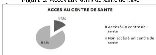
Figure 2: Accès aux soins de santé de base

Toujours en matière de conditions de vie du producteur, la figure 2 ci-dessous indique que seulement 15% des producteurs ont directement accès à un centre de santé contre 85% qui doivent parcourir une distance moyenne de 8,5 km pour pouvoir se soigner. Ce résultat montre que seulement une faible part des producteurs dispose d'un accès facile aux soins de santé de base.