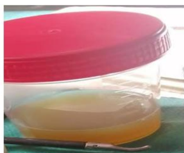
D- contenu kystique

En outre, les résultats anatomopathologiques ont confirmé qu'il s'agissait d'un kyste mésothélial de la rate.