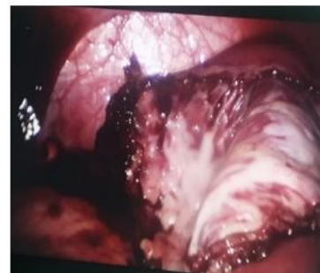
C-paroi interne du kyste