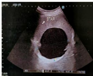
A – kyste splénique