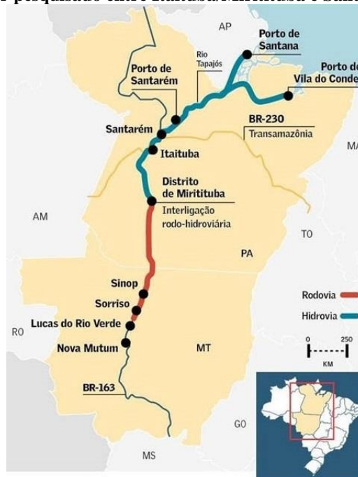
Figura 2 – Bacia Amazônica – Com anotação sobre o trecho a ser pesquisado entre Itaituba/Miritituba e Santarém

A escolha do rio Tapajós como modal hidroviário, se baseou em dois pontos cruciais: sua localização e suas características que segmentam o rio em três trechos de navegação praticamente isolados entre si (Figura 2).