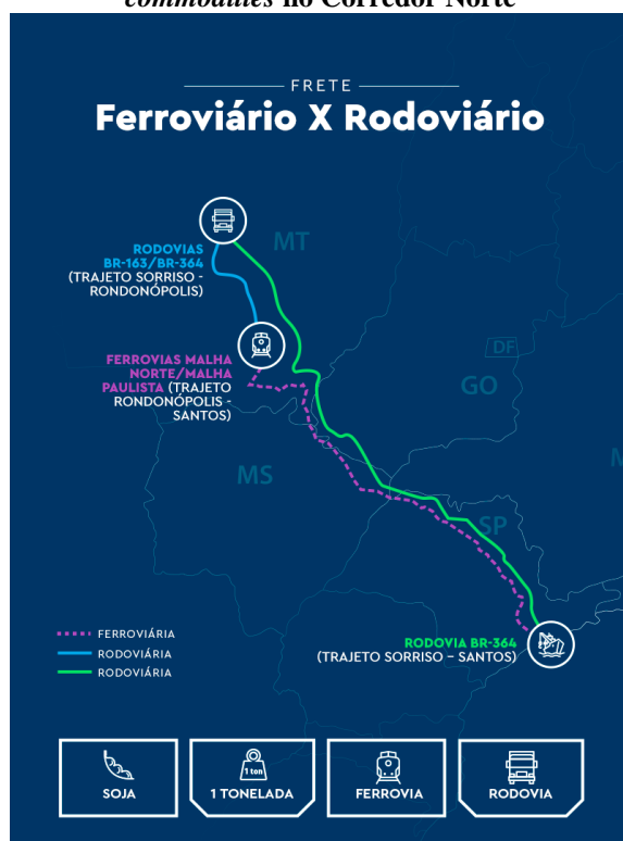
Figura 5 - Trajeto Rodoviário e Ferroviário das commodities no Corredor Norte

A ferrovia com 730 quilômetros em território mato-grossense (Figura 5), é fruto de uma parceria com o Governo do Estado, que definiu uma legislação própria para que a obra fosse feita pela iniciativa privada, colocando-a como primeira ferrovia estadual do país, a obra prevê investimentos que podem chegar a R$ 15 bilhões, 100% desembolsados pela Rumo S.A., a maior operadora de ferrovias do país. A primeira fase, que inclui o trecho Rondonópolis/Campo Verde (MT), com 211 quilômetros, foi iniciada em 2022 e prevê a conclusão em três anos.